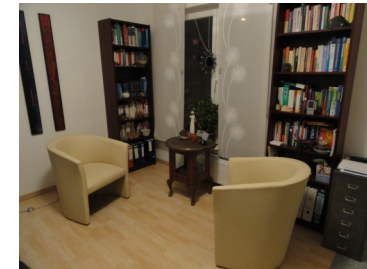
Beratungsraum in Netzbach